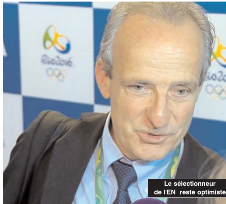
Le sélectionneur de l'EN reste optimiste