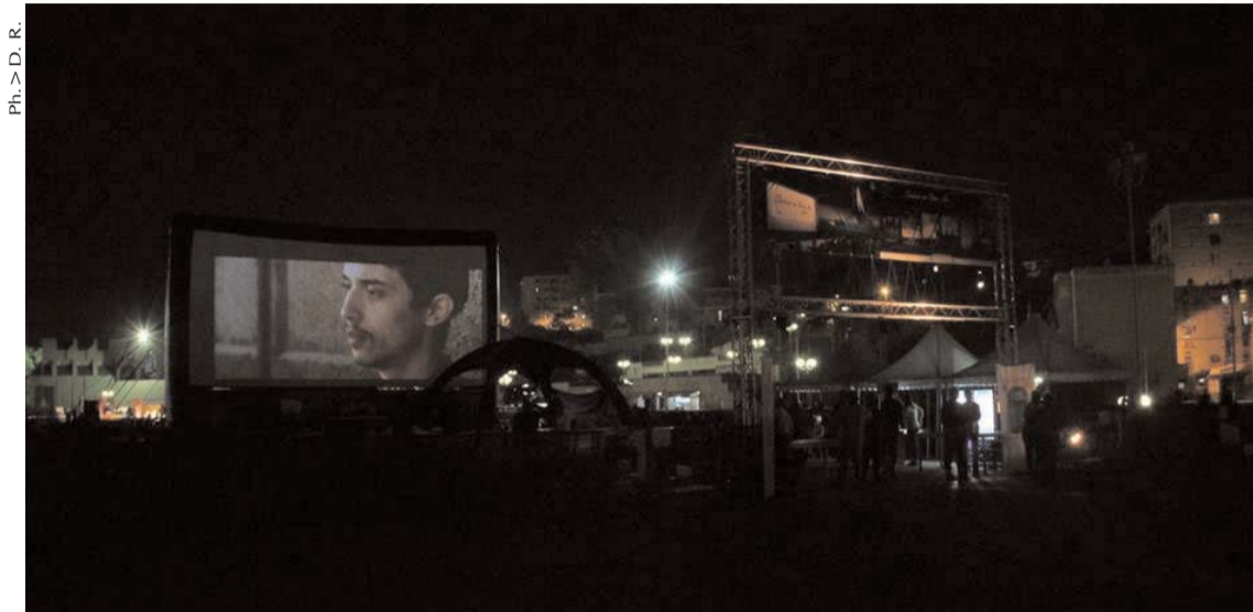
Par Abla Selles

■ Le cycle filmique Ciné-Plage revient cette année avec des films anciens et d'autres récents. Après avoir touché six plages l'année passée, l'évènement s'étale cette année sur neuf plages offrant aux vacanciers le plaisir de découvrir le cinéma en plein air et assister à des films algériens. Le choix d'un programme cent pour cent algérien s'inscrit dans les perspectives de l'Agence algérienne pour le rayonnement culturel qui œuvre à promouvoir le cinéma national.