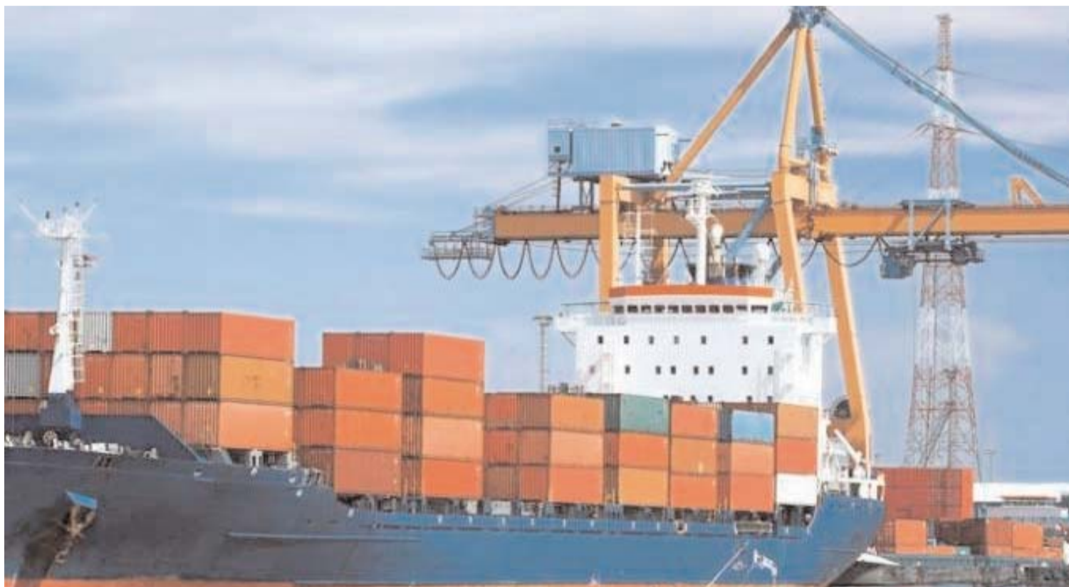
Ph. &gt; D. R.

■ La balance commerciale de l'Algérie avec la Grande zone arabe de libre-échange (Gzale) a affiché un déficit de 351 millions de dollars en 2015, contre un excédent de plus d'un milliard de dollars en 2014, a appris l'APS auprès de l'Agence nationale de promotion du commerce extérieur (Algex).