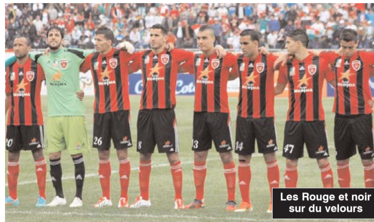
Les Rouge et noir sur du velours

C e tirage a également donné lieu à une autre rencontre entre deux pensionnaires de la L1, à savoir la JS Kabylie opposée au vainqueur du CS Constantine-USM Bel-Abbès, qui s'est joué hier à Blida. Les deux petits poucets de la compétition, à savoir le NRB Achir et le CA Kouba, pensionnaires de la division inter-régions (groupe Centre-est) en décourront pour une place en quart de finale. Le match entre l'USMA et l'ASO donnera lieu certainement à une opposition féroce entre deux formations qui connaissent des fortunes diverses en Championnat. Ainsi, les Rouge et Noir sont bien partis pour disputer le titre de champion à nouveau après l'avoir remporté la saison dernière, alors que les Chélifiens sont dans une situation très difficile et occupent l'avant-dernière place au classement général. La balance penche en faveur des Usmistes surtout que le match se jouera au stade Bologhine où ils sont intraitables, mais en Coupe rien n'est assuré et tout reste possible. Le MC Oran, lui trouvera, cer-