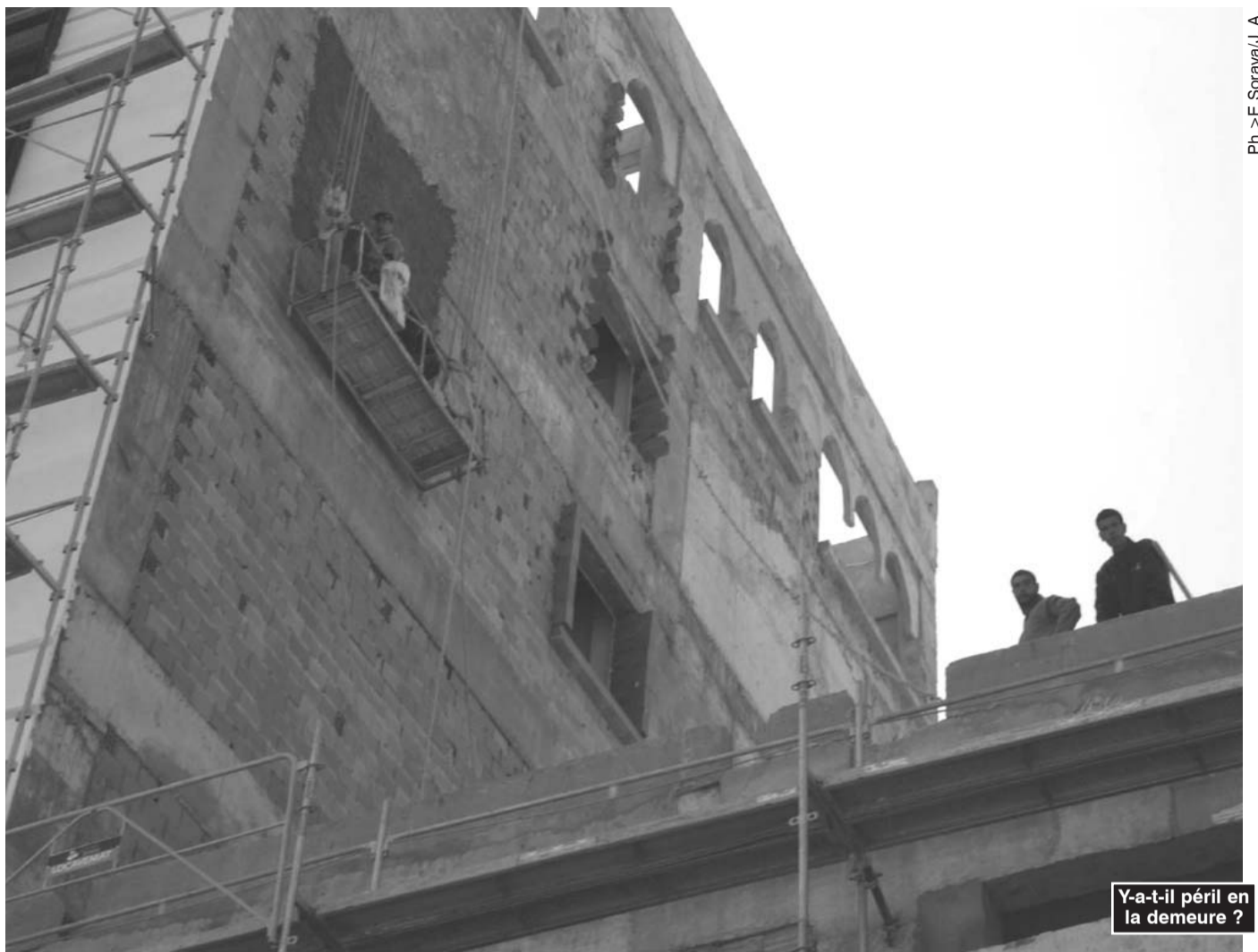
Y-a-t-il péril en la demeure ?

L'université Mentouri de Constantine, l'Institut national de commerce de Ben Aknoun, l'Ecole supérieure de commerce d'Alger, l'Institut national des télécommunications et des technologies de l'information et de la communication d'Oran et enfin l'Ecole nationale supérieure polytechnique d'Alger (El Harrach). R. N.