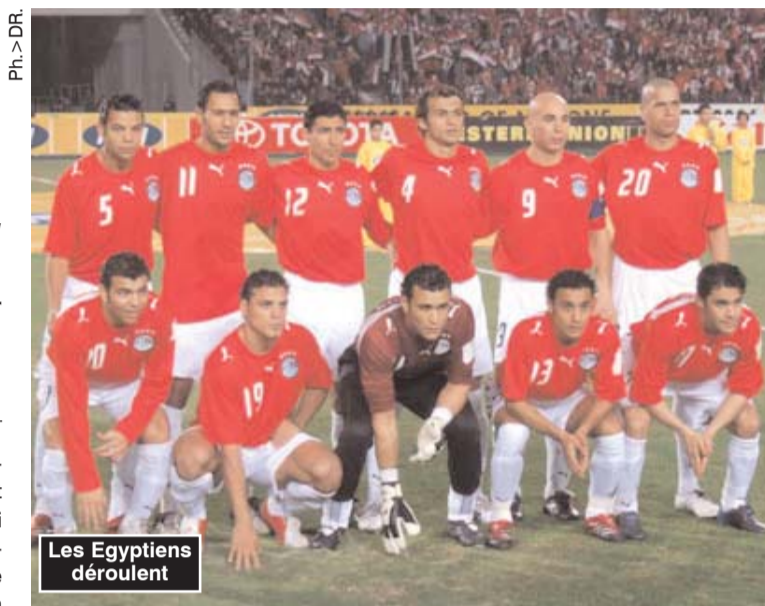
Les Egyptiens déroulent

Il a fallu attendre donc la deuxième période pour que l'Egypte se voit ouvrir les portes du succès, avec un premier but qui viendra à la 65' par