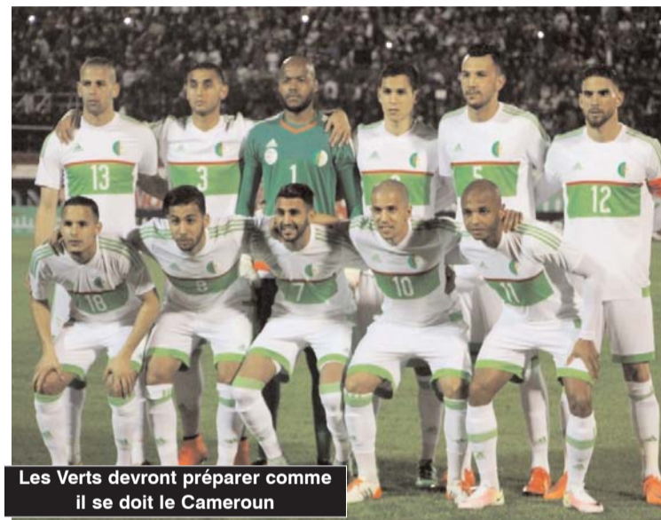
Les Verts devront préparer comme il se doit le Cameroun