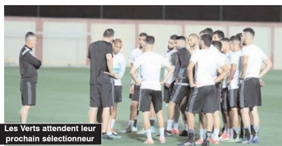
Les Verts attendent leur prochain sélectionneur

Plusieurs coaches ont été avancés jusque-là, mais les deux noms qui reviennent assez souvent sont ceux de l'ancien joueur et sélectionneur des Verts, Rabah Madjer, ainsi que l'ancien joueur de l'EN et entraîneur du Sad El qatari et du Qatar, Djamel Belmadi. Ces deux techniciens tiennent bien la corde pour le moment l'un d'eux est pressenti pour prendre en main la barre technique des Verts. Les responsables de la FAF n'ont pas tranché la question et devront attendre quelque peu avant de prendre une décision finale sachant que les dirigeants de la FAF se rencontreront une seconde fois pour décider. Pour ce qui est de ces deux techniciens pressentis, la balance pencherait beaucoup plus pour Madjer, étant donné que ce dernier est actuellement le conseiller du président de la FAF, Zetchi et que ce dernier le voit bien à la tête de la barre technique de la sélection nationale. Il compte lui donner sa chance malgré le fait que ce dernier est resté loin des terrains et n'a entraîné aucune autre équipe depuis son limogeage par la FAF