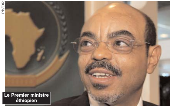
Le Premier ministre éthiopien

■ Dans un contexte mondial «instable» et un marché pétrolier mondial marqué par la chute des prix de l'or noir, Alger est la destination privilégiée de hauts responsables et délégations étrangères.