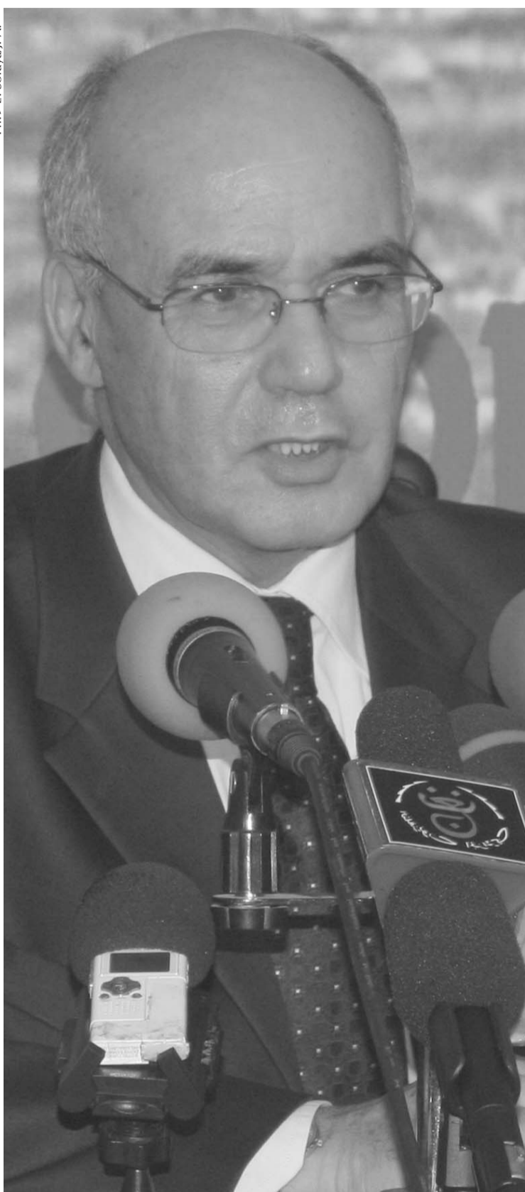
Ph. > E. Soraya/J. A.