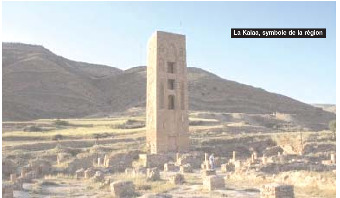
La Kalaa, symbole de la région

«Le délai de réalisation des projets a été prorogé pour nombre de sites du fait de la