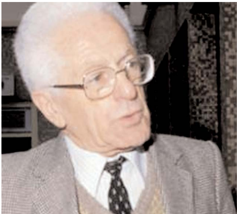
Par Abia Selles

■ La wilaya de Tlemcen abritera à partir d'aujourd'hui un forum sur l'écrivain et chercheur, Mouloud Mammeri, son œuvre et son apport à la guerre de Libération nationale, a-t-on appris auprès du Haut-Commissariat à l'amazighité (HCA), organisateur de cet événement. Des rencontres-débats, des conférences et autres activités sont au menu.