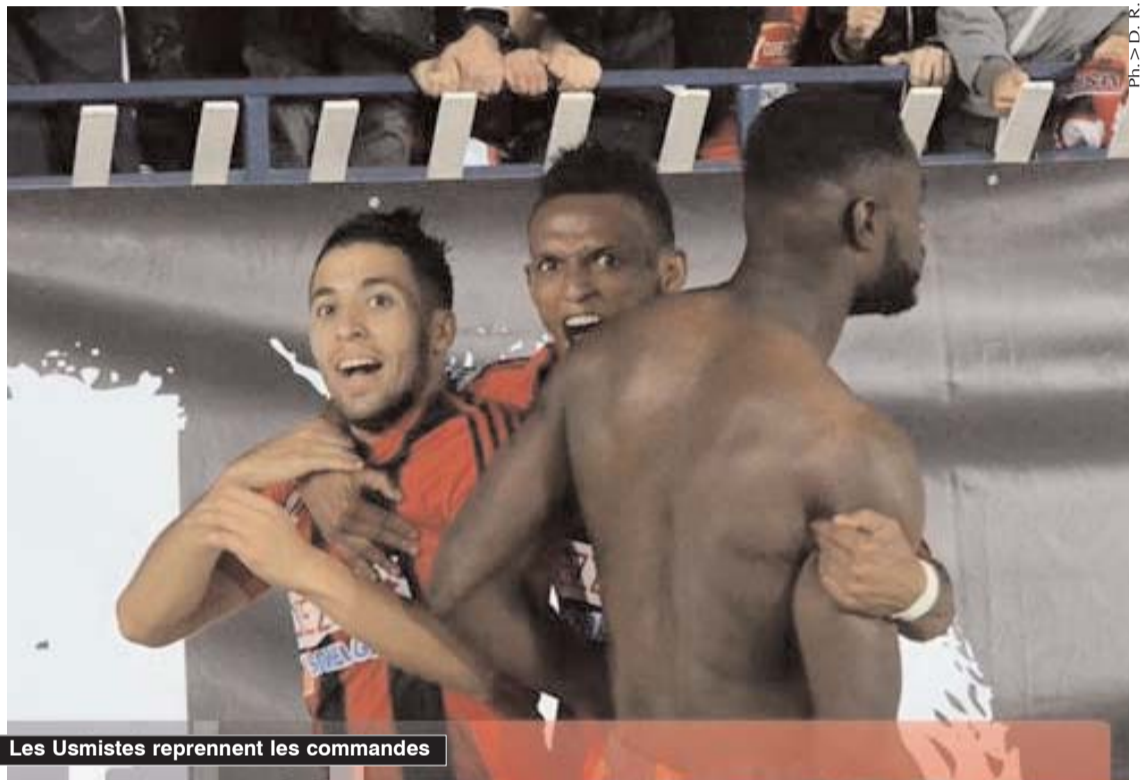
Les Usmistes reprennent les commandes

■ L'USM Alger a repris goût à la victoire en l'emportant hier face au Nasr d'Hussein-Dey lors du derby algérois qui s'est joué jeudi passé au stade du 5-Juillet.