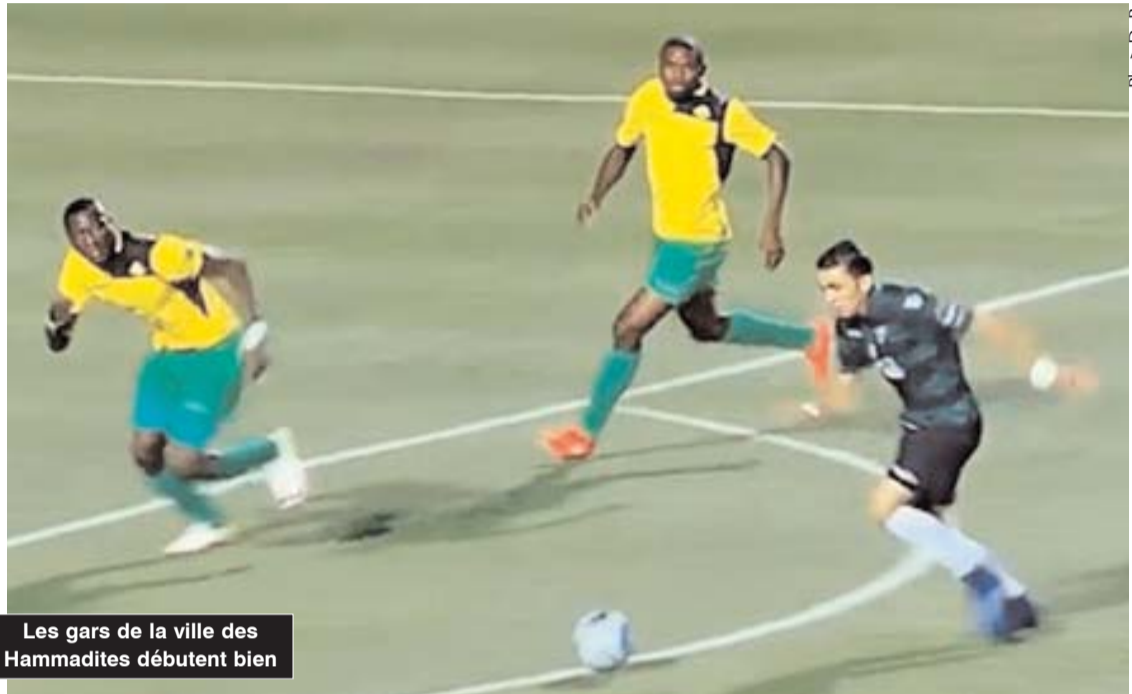
Les gars de la ville des Hammadites débutent bien

■ Le MO Béjaia, représentant algérien en phase de poules de la Coupe de la Confédération africaine de football, a bien débuté cette phase de la compétition en battant les Tanzaniens de Young Africans (1-0) dimanche soir au stade de l'Unité maghrébine de Béjaia.