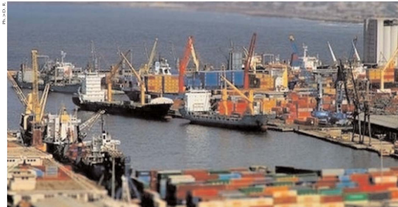
Ph. &gt; D. R.

■ Le déficit commercial de l'Algérie a atteint 9,8 milliards de dollars (mds usd) sur les cinq premiers mois de l'année 2016 contre un déficit de 7,23 mds usd à la même période de 2015, soit une hausse du déficit de 35,5%, selon les Douanes algériennes.