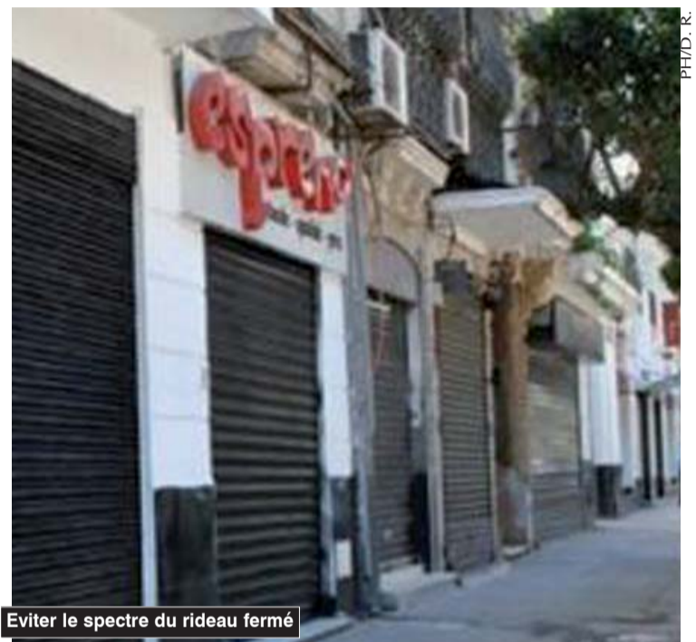
Eviter le spectre du rideau fermé

A la remarque que les pouvoirs publics ont mis deux mois à préparer l'approvisionnement du marché en prévision du ramad-