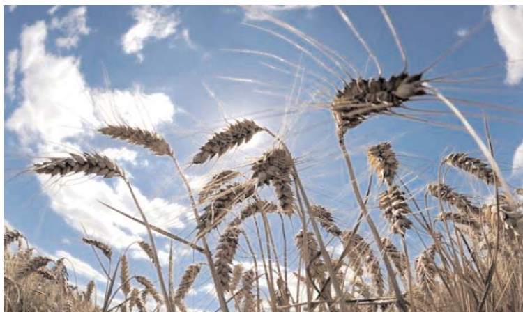
Une agriculture climato-intelligente