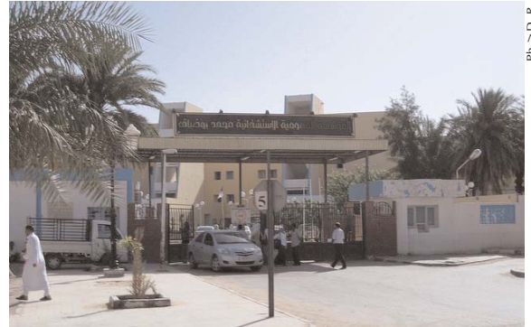
P.H. &gt; D. R.

Cependant, a-t-elle ajouté, ces effectifs restent encore «insuffisants» pour satisfaire totalement les besoins exprimés par les établissements hospitaliers.