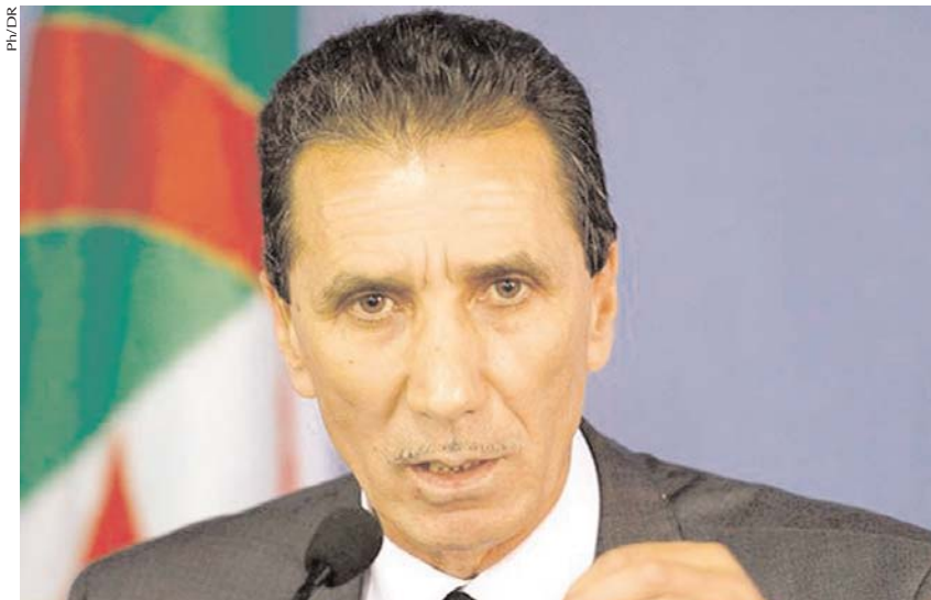
Par Nacera Chennafi

■ Finalment après des consultations marathoniennes avec différents partis, personnalités, société civile et autres, la conférence en vue de reconstruction d'un consensus national n'aura pas lieu ce 24 février comme souhaité par le FFS qui se trouve otage des contradictions idéologiques de la classe politique.