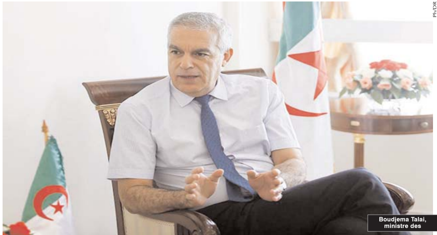
Boudjema Talai, ministre des

publiques budgétivores. La création de ces 4 groupes «autonomes» s'inscrit dans le cadre de la démarche du gouvernement pour reconfigurer le secteur public marchand. S'exprimant sur ce sujet, le conseiller du ministère des Transports, Mustapha Naci, a souligné hier sur les ondes de la Radio nationale que cette nouvelle stratégie, qui permet à chaque groupe de disposer d'un portefeuille particulier, entre dans le cadre de la modernisation et de la réorganisation de la gestion du secteur des transports qui connaît un retard par rapport aux besoins exprimés sur le plan économique. Selon lui, des groupements publics maritime, portuaire et routier, «auxquels des objectifs clairs ont été assignés, bénéficieront désormais d'une autonomie de gestion, leur permettant d'améliorer leur qualité de services et de développer leur