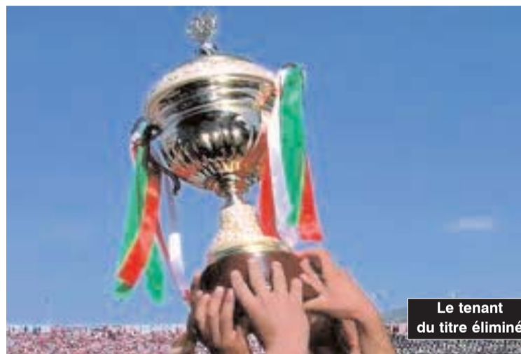
Le tenant du titre éliminé