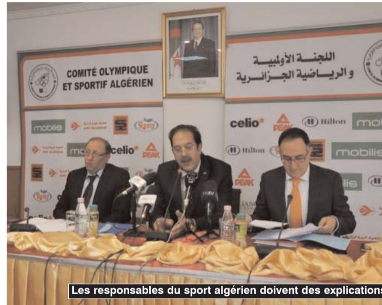
Les responsables du sport algérien doivent des explications