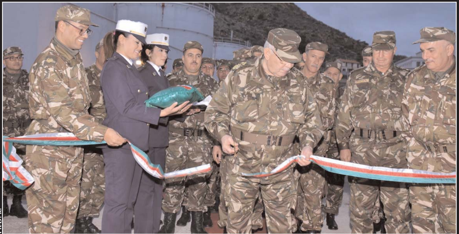
Le général de corps d'armée, Ahmed Gaïd-Salah, chef d'état-major de l'Armée nationale populaire qui était jeudi en son troisième jour de sa visite en 2 e Région militaire, a appelé à une «extrême vigilance» face à des «ennemis» de l'Algérie. Lire page 3