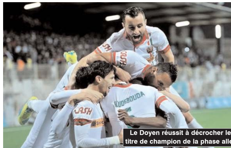
Le Doyen réussit à décrocher le titre de champion de la phase aller

Galvanisés par cette ouverture du score, les Algérois ont réussi à doubler la marque par Nekkache (33'). Embusqué devant la cage de Toulal, le trans-fuge du CRB a profité d'une mal-