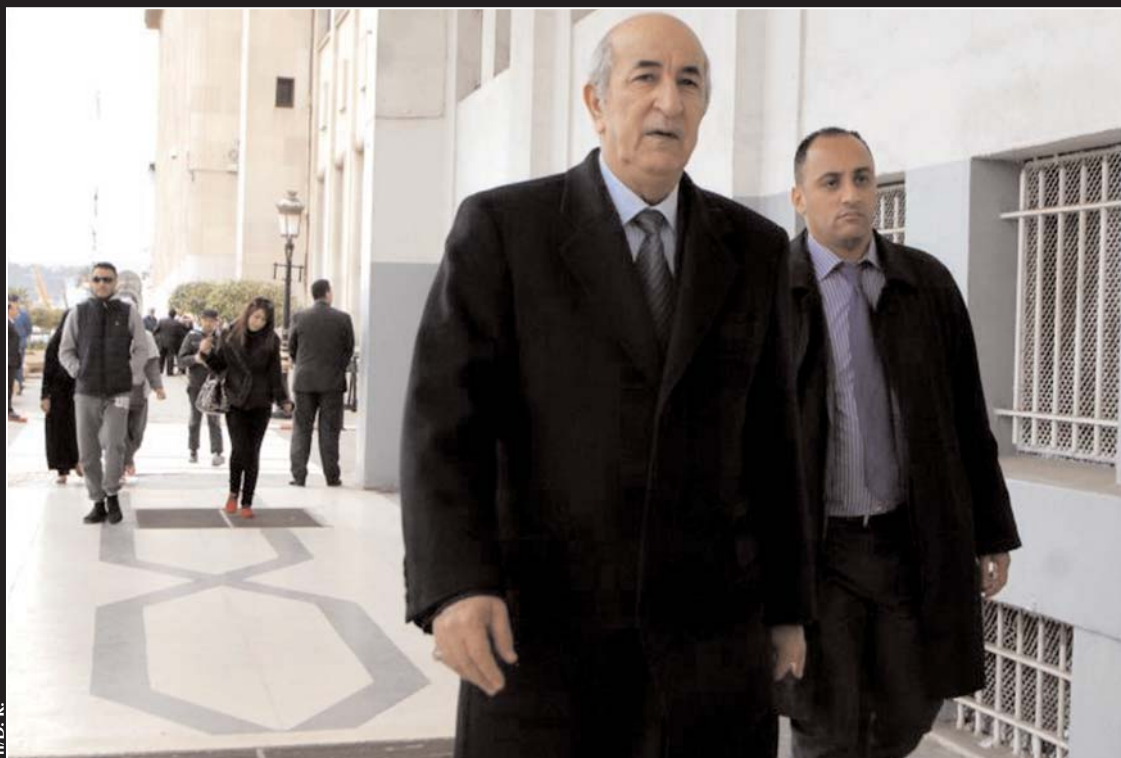
Après plusieurs jours de suspense sur la nomination d'un Premier ministre, le président de la République a désigné, hier, Abdelmadjid Tebboune, anciennement ministre de l'Habitat et intérimaire du Commerce depuis les législatives, à la tête du gouvernement en remplacement de Abdelmalek Sellal. Lire page 3