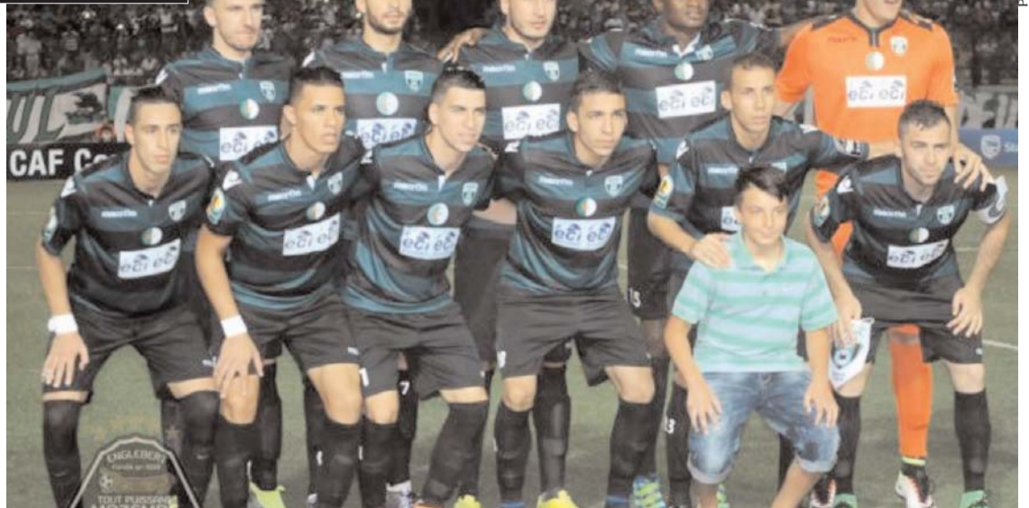
Par Mahfoud M.

Il faut savoir que les Crabes ont passé quelques jours à la ville touristique tunisienne de Sousse pour préparer ce rendez-vous loin de toute pression. Ils sont revenus hier et se sont retremés dans le bain de l'ambiance qui règne aux fiefs du club à la vallée de la Soummam où la fièvre monte depuis quelque temps parmi les supporters surexcités, surtout qu'il s'agit d'une finale historique pour le club qui vit un véritable conte de fée. Le staff technique est très satisfait du travail effectué en Tunisie, surtout que l'équi-