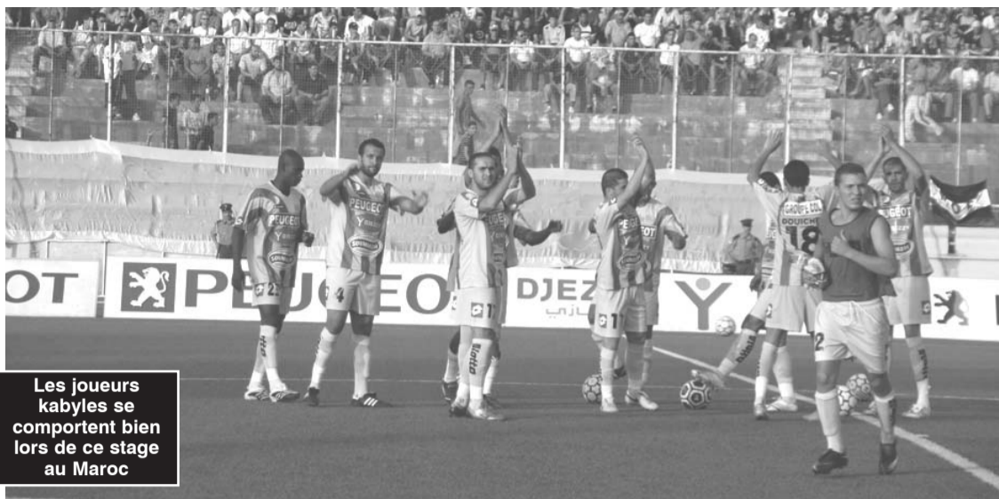
Les joueurs kabyles se comportent bien lors de ce stage au Maroc