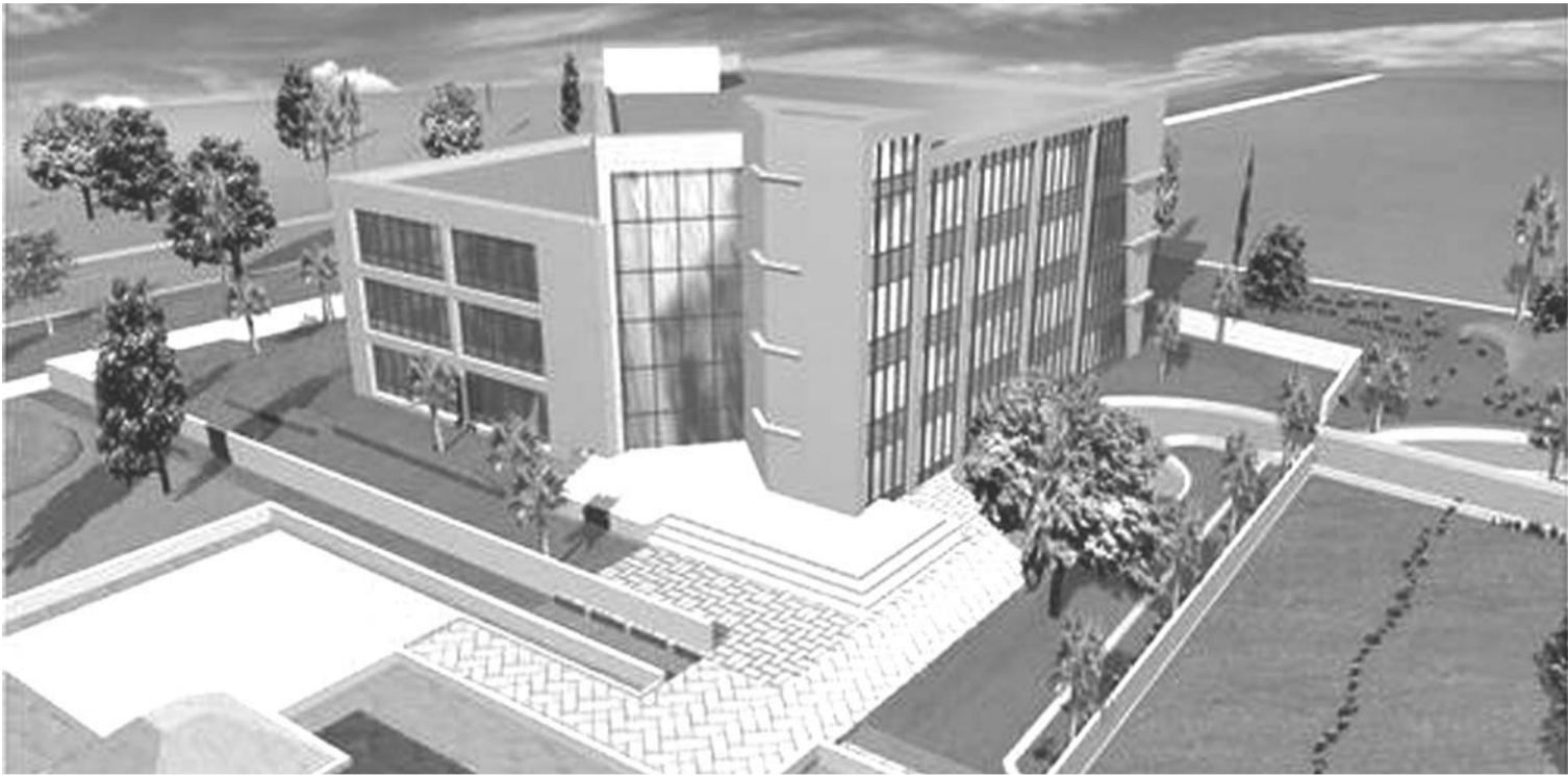
Cyberparc de Sidi Abdellah