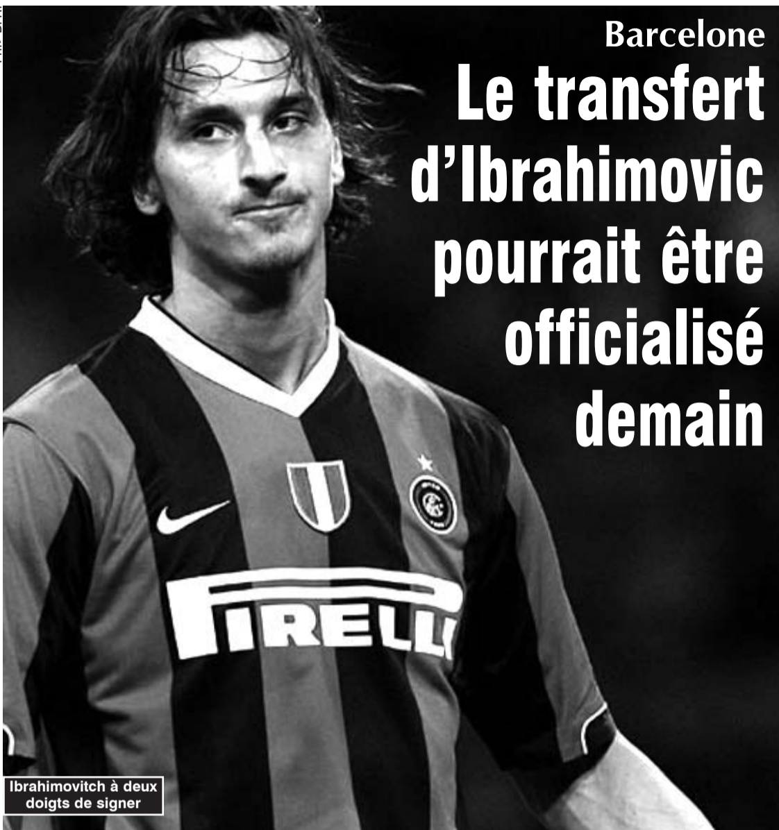
Ibrahimovitch à deux doigts de signer

■ L'attaquant suédois Zlatan Ibrahimovic, 27 ans, est attendu aujourd'hui à Barcelone, où il passera demain une visite médicale, «condition préalable à son incorporation au club», a annoncé vendredi soir un communiqué du FC Barcelone.