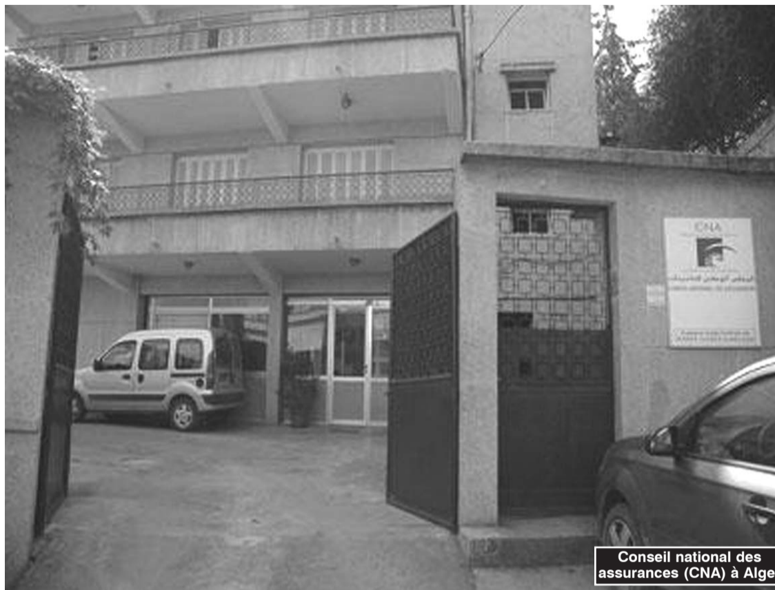
Conseil national des assurances (CNA) à Alger

Le CNA rapporte aussi que la hausse de 4% du chiffre d'affaires en «facultés maritimes» ne semble pas suivre celle, plus importante, du volume des importations qui a connu au 1 er trimestre 2009 une augmentation de 17,8% par rapport aux résultats du premier trimestre 2008. Il explique cette situation, d'une part, par «le report lors des émissions de polices importantes en transport de facultés en rapport avec les projets d'investissements initiés par les pouvoirs publics. D'autre part, la sous-tarifification des risques, induite par le jeu de la concurrence aurait également un impact sur le niveau des primes afférentes à cette branche».