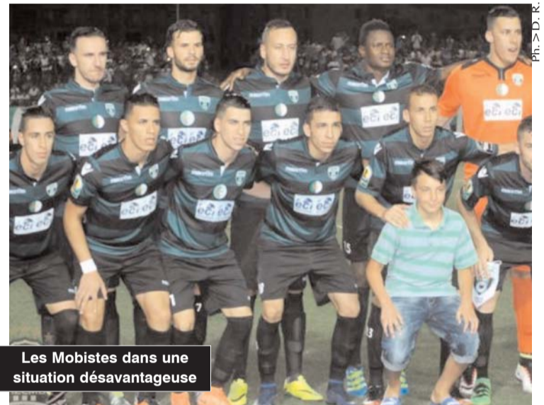
Les Mobistes dans une situation désavantageuse

En effet, il faut savoir qu'avant le résultat des demi-finales, il était convenu que le vainqueur entre le MOB et le FUS joue la finale retour chez lui. Mais ce n'est plus le cas, car la CAF a décidé que c'est le MOB qui recevra lors du match aller alors que la manche retour aura lieu à Lubumbashi, c'est-à-dire chez le TP Mazembé, qui aura un avantage certain. La finale aller devrait avoir lieu le 28 octobre prochain à Béjaïa alors que la rencontre retour est prévue le 4 novembre prochain à Lubumbashi. Il est quasiment certain que les Congolais ont fait valoir le jeu de coulisses pour changer la situation et se faire avantager par la CAF qui ne porte pas dans son cœur les clubs algériens en général. Il faut juste voir comment la CAF avait écarté l'Algérie de l'organisation de toutes les éditions de la CAN qui étaient prévues jusqu'à 2021. En outre, les dirigeants de la FAF ne font rien pour préserver les