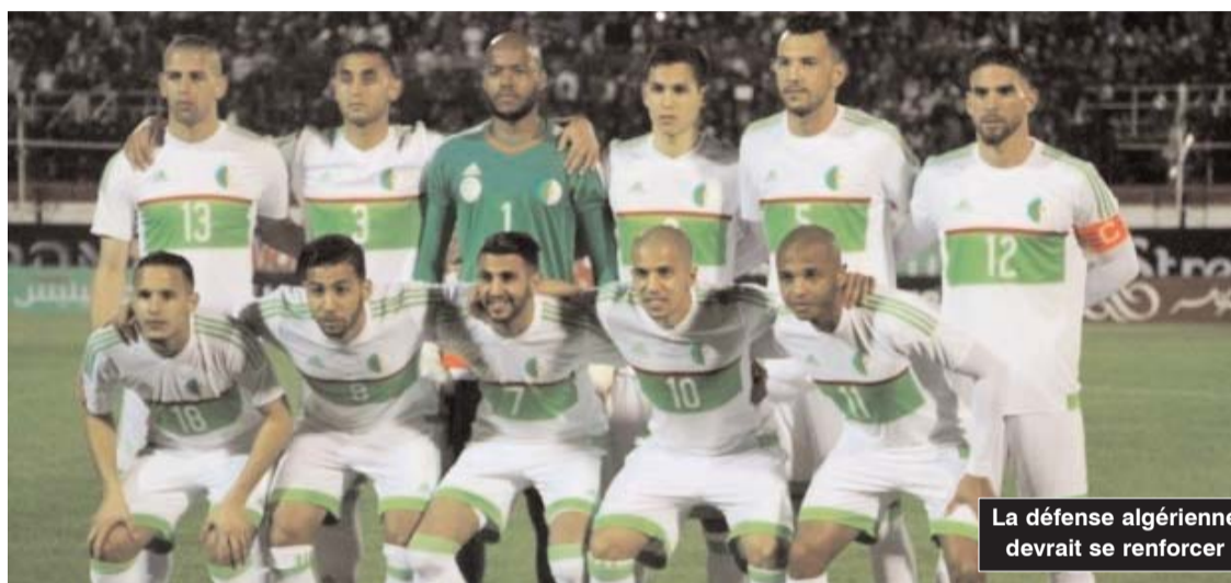
La défense algérienne devrait se renforcer

■ Certes, la sélection nationale a fait un grand pas vers la qualification à la phase finale de la CAN 2017 au Gabon avec ce match nul arraché en terre éthiopienne. Dans le même temps, les trois buts encaissés par notre arrière-garde et notre gardien Mbolhi démontrent qu'il y a un grand travail à faire pour permettre aux Verts d'être irréprochables.